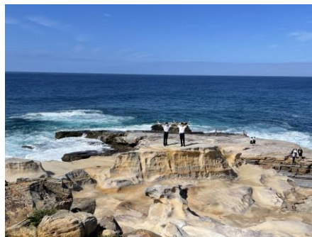
千畳敷は波がすごい