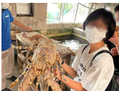
水族館での飼育体験