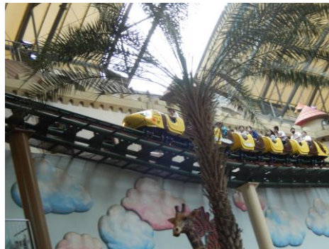
屋根付きアトラクション