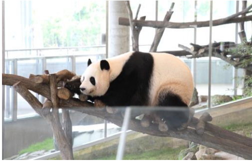
パンダは7頭飼育されています