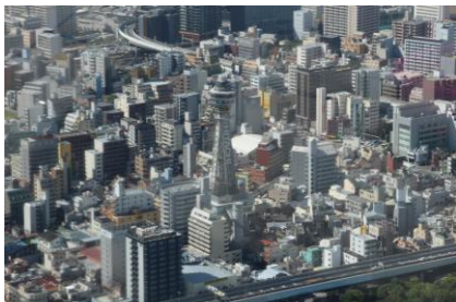
小倉駅から新幹線を利用 あべのハルカス 展望台（あべのべあと通天閣）

【 2日目 】 ホテル → 貸切バス → 熊野那智大社・熊野古道 → 体験活動 → ホテル 熊野那智大社を参拝し、那智の滝を眺めたあと、熊野古道ウォークをしました。午後から、①串本海中公園での水族館飼育体験、②串本町文化センターでの流木シーグラス・カレンダーづくり、③道の駅橋杭岩でのトルコランプづくり、の3グループに分かれて体験活動をしました。