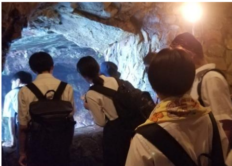
海面洞窟の中央に降りて見学です

【 4日目 】 ホテル → 貸切バス → 三段壁洞窟・千畳敷 → 新大阪 → 新幹線 → 小倉駅 最終日は、三段壁洞窟と千畳敷を見学したあと、新幹線で帰路につきました。