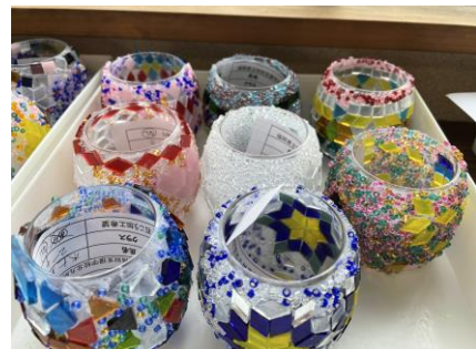
トルコランプの製作体験