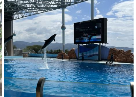
マリンライブで感動しました