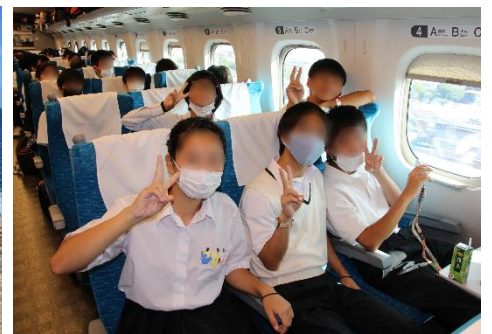
帰りの新幹線でも元気です

3年ぶりに、予定した目的地を変更することなく実施できた修学旅行でした。お天気にも恵まれ卒業後でもなかなか訪れることの少ないであろう観光地を、観光客が非常に少ない時期に見学することができ、実り多い4日間となりました。