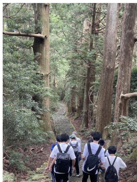
熊野古道を下りました