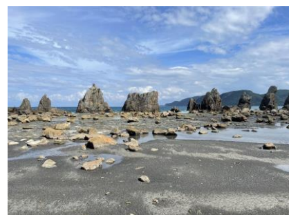
橋杭岩（はしぐいいわ）