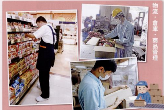
物流・倉庫・商品管理

という結果でした。お給料には、どれくらいの長さを働くことができるのかという持久力や集中力が関わっていることがわかりました。