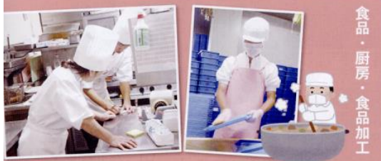
食品・厨房・食品加工